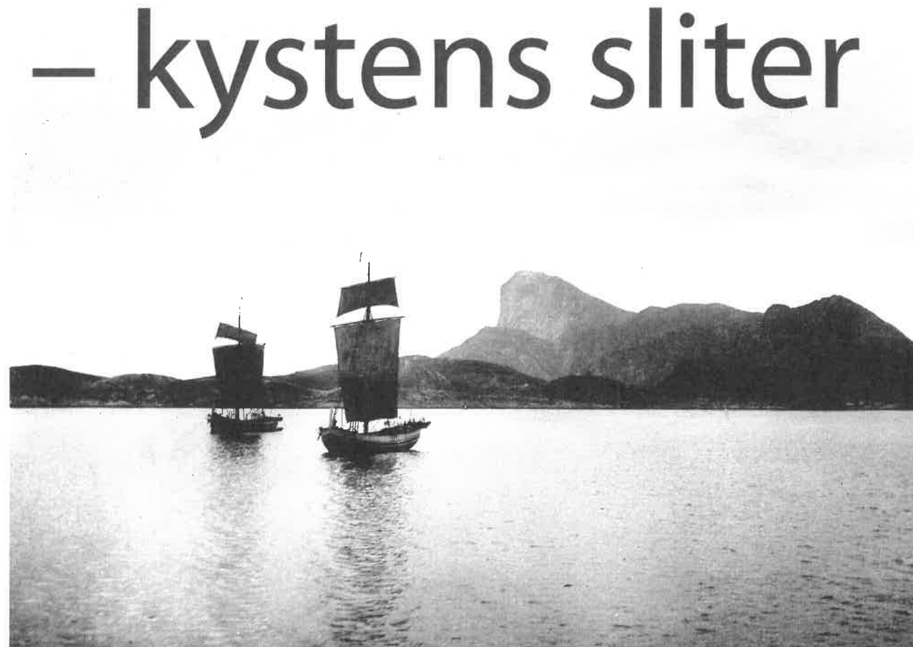
HELGELAND: Helgelandskysten sto sentralt i jektas historie. Her ble mange jekter bygget, og fra Helgeland ble mange av dem drevet. Så langt som til Finnmark dro de for å kjøpe og selge varer. Her to jekter med Rødøylova i bakgrunnen.

Museet vil ha åpent søndag 1. desember og 8. desember, kl. 12.00-15.00. Da vises det juleutstillinger og mulighet for å lage gammeldags julepynt. Gratis inngang!