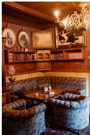
Herresalongen: Her møttes byens mektigste og rikeste menn til pølter, sigar og samtaler.