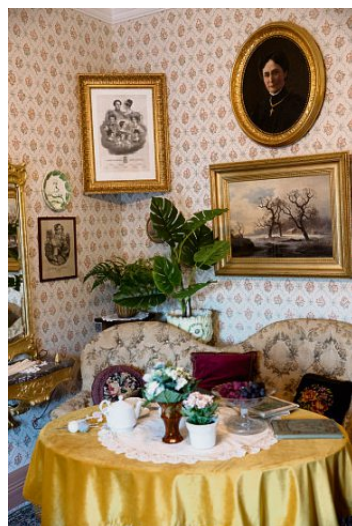
Feminin avdeling: Mens herren i huset inviterte på pølter og sigar i en annen avdeling, samlet kvinnene seg i en mer feminin stue.